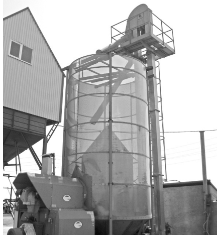
Новое сушильное оборудование готово к работе