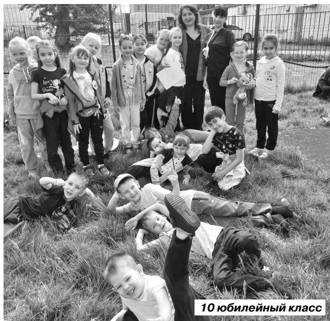
10 юбилейный класс

– Вчерашние дошколята приходят в школу с широко открытыми глазами, словно птенцы вылетают из родительского гнезда. Родители передают в руки учителя своё драгоценное сокровище.