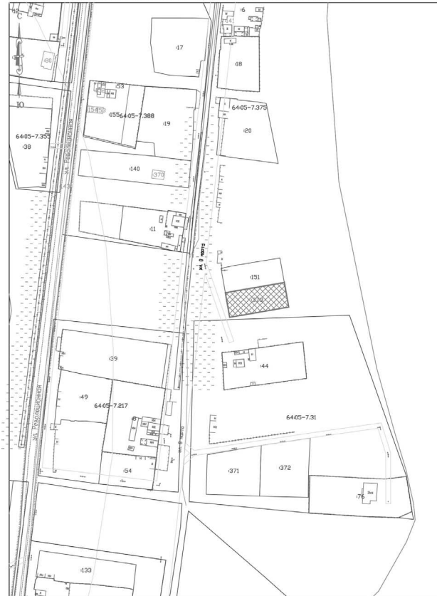
Схема N_9 Кадастровый квартал 64:05:111203 Саратовская область, Балаковский район, с.Кривоулье-Сура