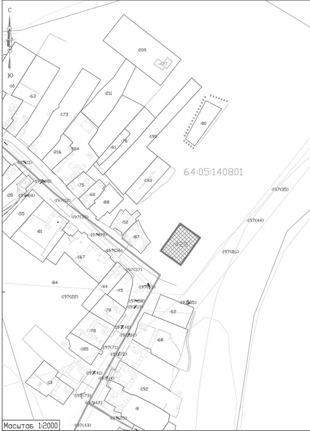
Схема N_5 Кадастровый квартал 64:05:140801 Саратовская область, Балаковский район, х.Тулилкин