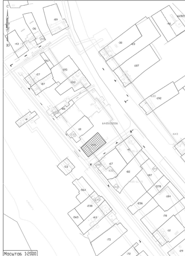
Схема N_6 Кадастровый квартал 64:05:150506 Саратовская область, Балаковский район, с.Маянка