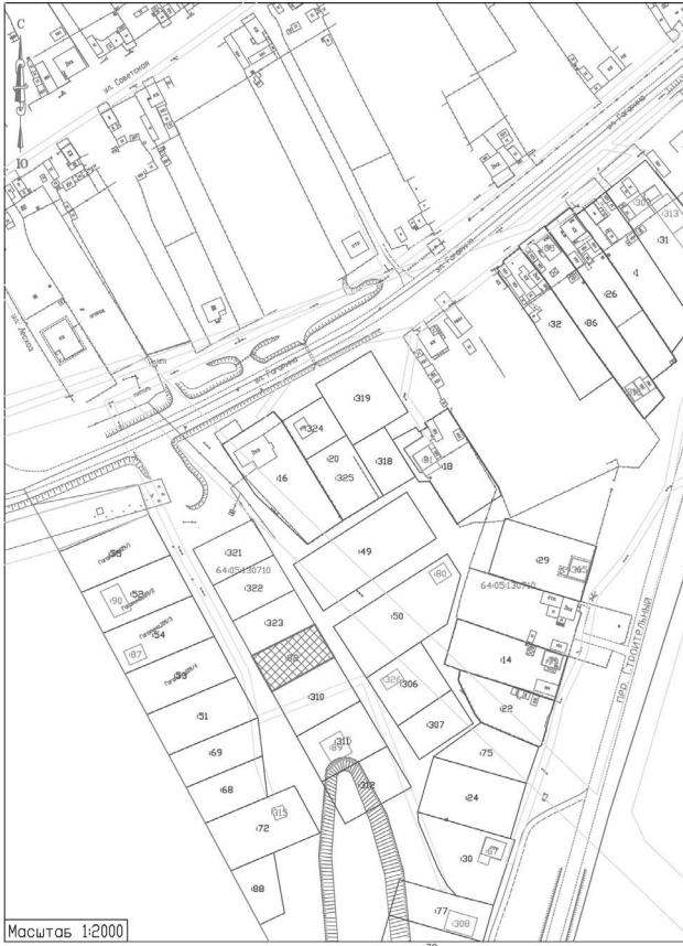
Схема N_8 Кадастровый квартал 64:05:130710 Саратовская область, Балаковский район, с.Ивановка